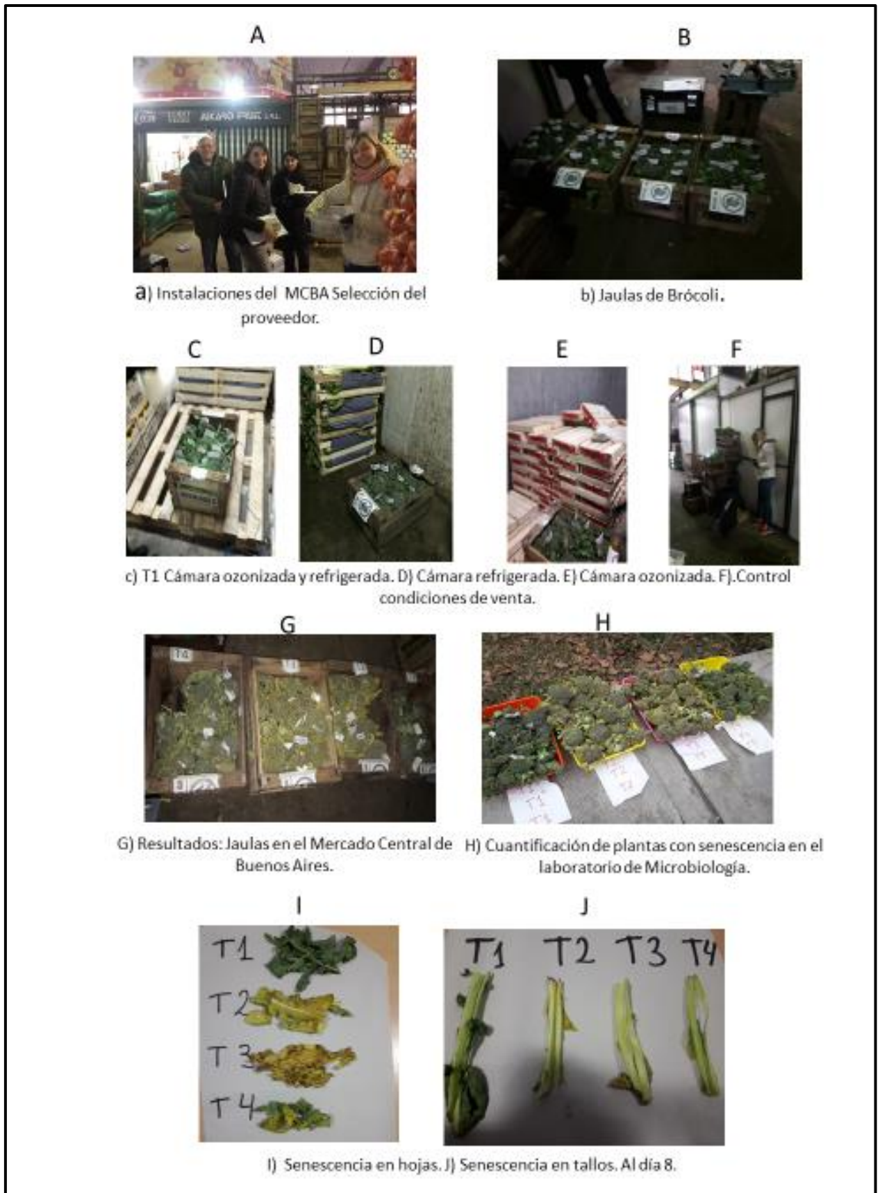
Figura 1. Ensayo de senescencia en plantas de brócoli