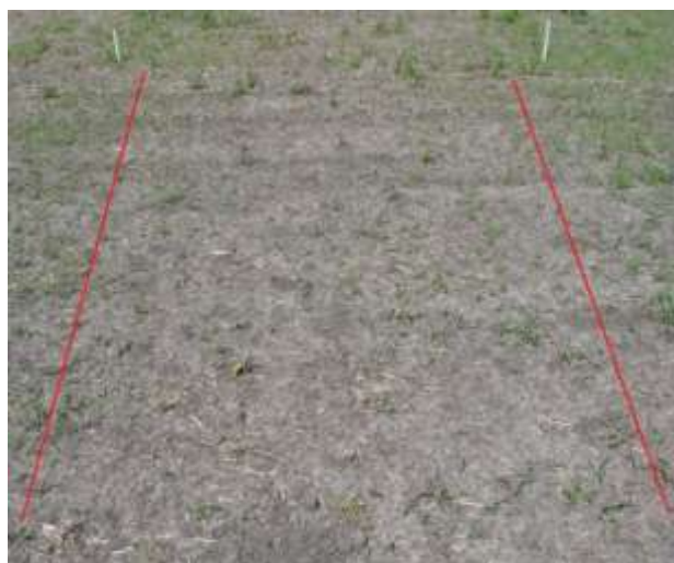
Figura 2. Parcela tratada con desecante a 15 DDA.

Los recuentos de plántulas se iniciaron 15 días luego de la aplicación (DDA) (Figura 3) con una frecuencia de 12-15 días aproximadamente. Una vez realizado el recuento inicial se efectuó el control total o reseteo de la superficie ocupada por los cuadrantes con el fitosanitario desecante para permitir los nacimientos y facilitar los recuentos posteriores.