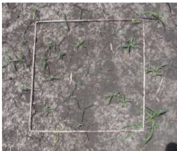
Figura 1. Cuadrante de muestreo (0,25 m 2 ).

Luego de marcadas las parcelas (Figura 2), se pulverizaron el 12/10/2015 con un desecante (Paraquat) a la dosis recomendada para siembra directa de 552 g i.a. ha -1 (276 g e.a. litro -1 ).