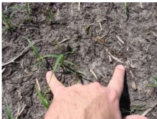
Figura 3. Momento del recuento donde se observan plántulas quemadas y nuevos nacimientos.

La emergencia acumulada se estimó mediante la fórmula: k = k' / kt , donde k es el porcentaje de emergencia, k' es el número de plántulas emergidas y kt es el número de emergencia total (Picapietra y Acciaresi, 2015).