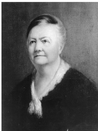
Retrato de Cecilia Grierson

Esta notable mujer, la primera en obtener un título universitario en nuestro país, fue descendiente de los colonos escoceses establecidos en Santa Catalina, allá por 1825. Fue ella quien escribió, cien años después del establecimiento de la colonia, en 1925, un pequeño libro titulado “Colonia de Monte Grande. Primera y única colonia formada por escoceses en Argentina” impreso en los Talleres S.A. Casa Jacobo Peuser, Ltda.